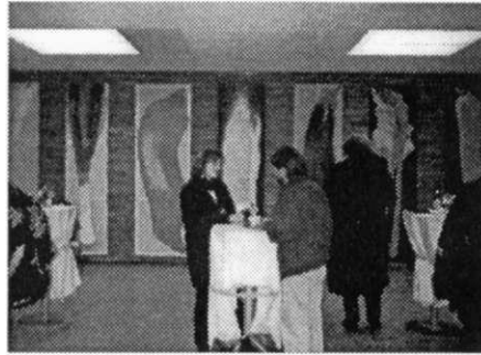
Zehn Jahre Gegenwartskunst und Kirche Gespräche im Foyer des Hospitalhofs

Spiritualität, weltliche Kultur und kirchliche Frömmigkeit sollten zueinander finden. Die Bildung der natürlichen Vernunft und die Kulturarbeit der Menschen sollten gefördert werden, aber sich nicht in geistigem und geistlichem Hochmut, sondern in der Erkenntnis Gottes als des Schöpfers und Versöhners vollenden. Das macht Melanchthon und seinen Protestantismus uns Heutigen nah.