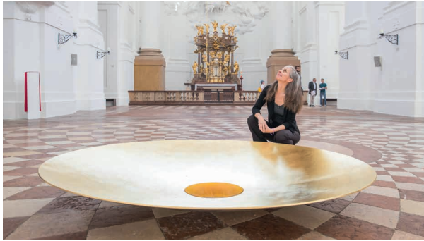
„Honighimmel“, Installation von Sonja Meller (2019) Kollegienkirche Salzburg

Die 1992 gegründete Gesellschaft will den Dialog zwischen der Gegenwartskunst und den Kirchen fördern. Kunst und Religion sind Geschwister, beide suchen Antworten auf Grundfragen der menschlichen Existenz. Die Künste können in vielfältiger Weise religiöse Erfahrungen spiegeln, umgekehrt sind religiöse Erfahrungen oft auch ästhetische Erfahrungen. Artheon ist ein Netzwerk von Personen, die an einem qualifizierten Dialog zwischen Kunst und Religion bzw. Kirche interessiert sind. Die Gesellschaft bietet Foren für diesen Dialog.