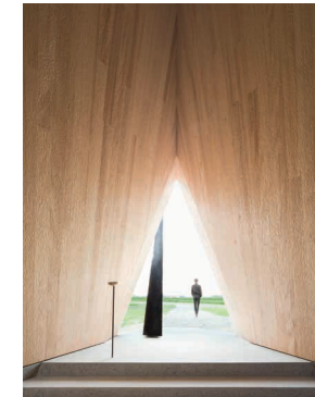
jasarevic architekten und Josef Zankl Wegkapelle Schwaigen in Buttenwiesen (2020)

Artheon.Regional dient dem Austausch der Mitglieder auf regionaler Ebene durch selber oder mit Kooperationspartnern organisierte Aktivitäten wie Ausstellungs- und Atelierbesuche, Vorträge oder Exkursionen. Die Programme und Kontaktpersonen finden sich auf der Webseite von Artheon. www.artheon.de/regional.html