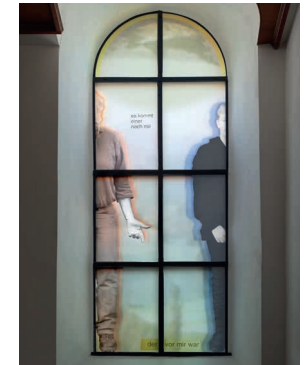
Angelika Weingardt „ES KOMMT EINER NACH MIR, DER VOR MIR WAR“, Tauffenster Ev. Ulrichskirche Weissach (2020) © VG Bild-Kunst Bonn, 2022